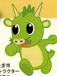
さいたま市 PRキャラクター つなが竜ヌウ