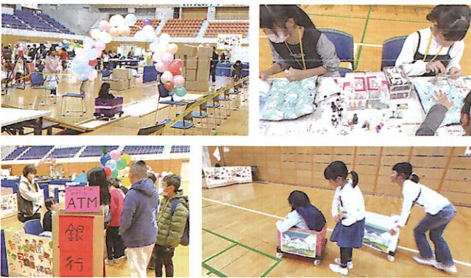
※昨年のリアル会場の様子

かがく サイデン化学ア リーナさいたま にちかぎ に1日限りの子 どものまちがやっ ってくる！スマイ ルタウンの市民 になって、お仕 事をしたり遊ん だりしよう！